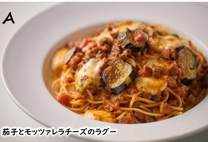
茄子とモッツアレラチーズのラグー