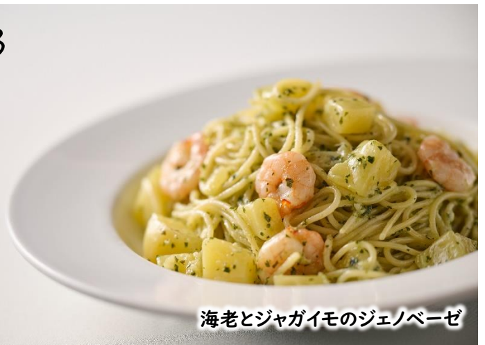
海老とジャガイモのジェノベーゼ